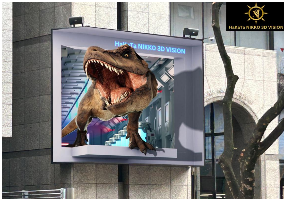
博多日光 3D ビジョン