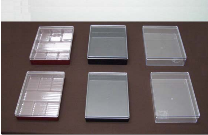
スチロール平角ケース商品 一例